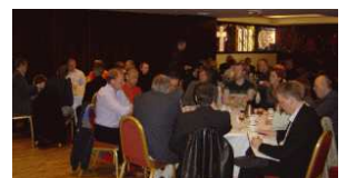
Fundarmenn á morgunverðarfundum vorið 2007

Fræðslunefnd hvetur félags- menn til þess að senda sér ábendingar um áhugaverð efni og fyrirlesara sem erindi gætu átt við félags- menn.